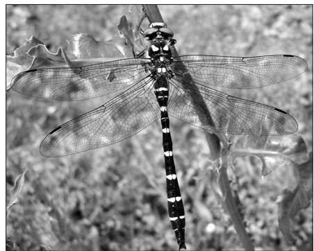
Abb. 3: Männchen der Gestreiften Quelljungfer ( Cordulegaster bidentata). Die Art ist im NSG „Schaichtal“ charakteristisch für Quellsümpfe am Südhang des Tals am Übergang von Buntem Mergel auf Stubensandstein.

Cordulegaster bidentata (Abb. 3) war 2008 im NSG „Schaichtal“ vor allem innerhalb von Quellsümpfen mit Riesen-Schachtelhalm ( Equisetum telmateia ) und den obersten Abschnitten von Quellbächen am Südhang, wo die Bunten Mergel auf Stubensandstein treffen, nicht selten. Die Art konnte an allen Quellsümpfen festgestellt werden, zur Jagd wurden angrenzende Wiesenflächen genutzt. Der früheste Nachweis einer der charakteristischen Exuvien erfolgte Mitte Mai am Schlüsselsee. Dieser für diese Art ungewöhnliche Fundort ist wohl darauf zurückzuführen, dass der Schlüsselsee in direkter Verbindung mit einem etwas höher gelegenen Quellsumpf liegt, von dem die Larve dann wohl in den See gewandert ist. Weitere Exuvien und Imagines wurden Ende Mai bis etwa Mitte Juli (Imagines) gefunden.